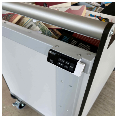
Æstetisk og enkel i brug