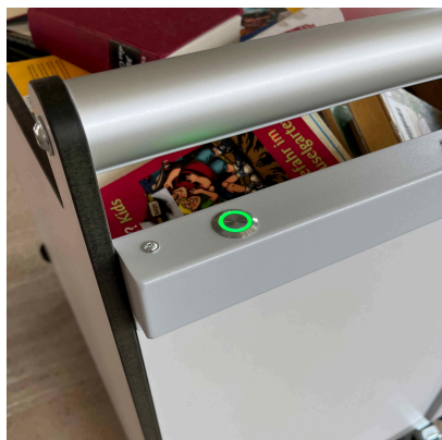
Innovativt og uden kabler

Som en option kan bogvognen være elektronisk låst, når den er tilsluttet sorteringsystemet. Bogvognen findes i forskellige størrelser.